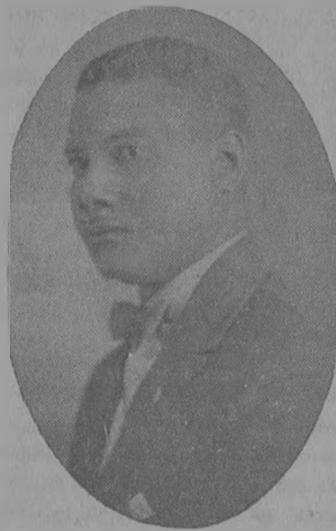
LICENCIADO FAUSTINO A. FIGUEROA

—Dónde vas, Alfonso XIII? Dónde vas? Triste de tí!---- —Voy huyendo, pues parece Que ya estoy demás aquí. (Pasa a la pág. 8)